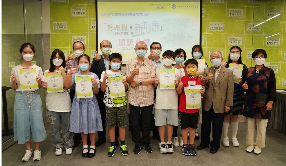
圖二：香港新聞博覽館舉行「舊報攤·新形象」填色創作比賽頒獎典禮。